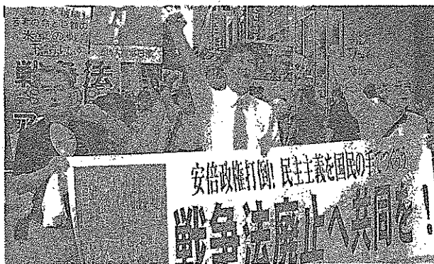
戦争法廃止を訴えパレードする共同センターの人たち＝21日、神戸市中央区