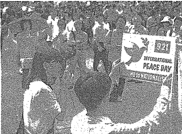
「安保法にNO」と訴える参加者＝21日、東京都渋谷区