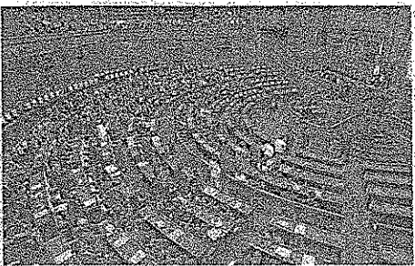
参事院の安全保障特別委員会が採決する様子を19日未明、国会内で撮影

「日本が再び戦争に巻き込まれる危険を高める」として、戦争法を廃止する人々が増えている。戦争法は、日本が自衛隊員を海外に派遣し、戦闘行為に巻き込むことを可能にする。これは、日本が再び戦争に巻き込まれる危険を高める。戦争法は、国民の命を危険にさらす。戦争法を廃止し、日本を平和な国に戻さなければならない。