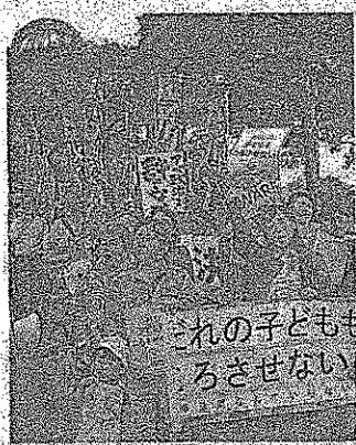
午後5時54分 広島市 駅前ドームのそばで安倍法案に抗議する人たち