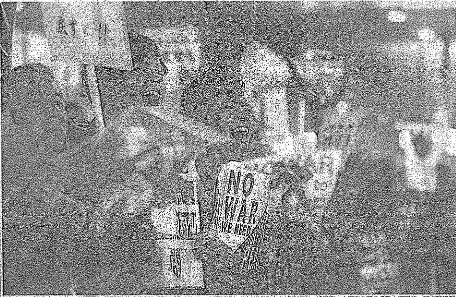
安倍憲法法案の採決反対を叫ぶ「SEALDs KANSAI」の街頭活動に参加し、声を上げる若者＝14日夜、大阪市北区のJR大塚駅前、熊本県熊本市