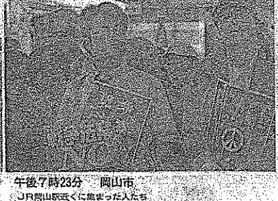
午後7時23分 岡山市 JR岡山駅近くで集まった人々