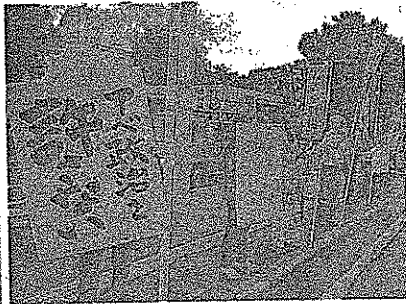
戦争法案廃案を訴える参加者=17日、神戸市

【東京】 参議院選 選区は「日本は戦争会での採決強行への動きをしない憲法を持ってきて受け、福岡市議会では日本共産党、民主党系、社民党、緑の党、ネットの4会派は議員が採決強行に抗議、廃案を求める緊急共同声明を発表。 【福岡】 神戸市東灘区のJR住吉駅前前で東灘憲法共同センターの約30人が「強行採決許さない」などのシュプレヒコール。下校する小学生たちも「戦争反対」と叫びます。プラカードを手にスタンディングしていたアメリカ人（大学教員）の男性(54)は「東