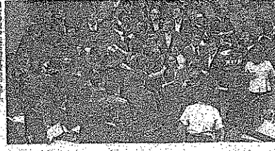
参院本会議で議決された戦争法案。参院議員は、議決後、議事堂前で抗議の声をあげた。