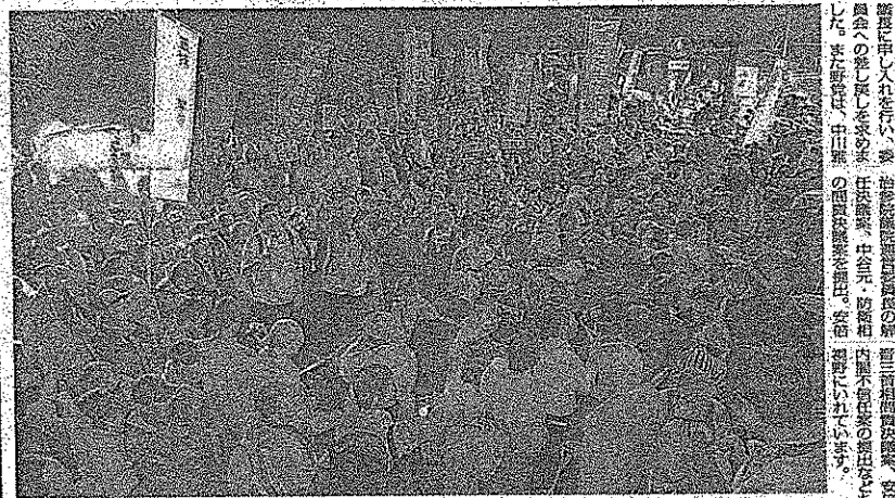
参院本会議で議決された戦争法案。参院議員は、議決後、議事堂前で抗議の声をあげた。

参院本会議は、昨日午後二時開会し、戦争法案の採決を行った。参院議員は、議決後、議事堂前で抗議の声をあげた。野党は、法案の成立を阻止し、日本共産党は、野党の連帯を呼びかけた。参院本会議は、午後八時三十分閉会した。