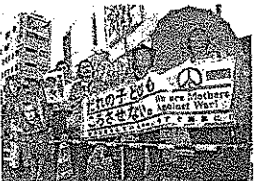
街頭で声を上げる若者の、午後7時4分、高崎市