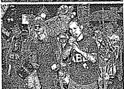
街頭で声を上げる若者の、午後7時4分、高崎市