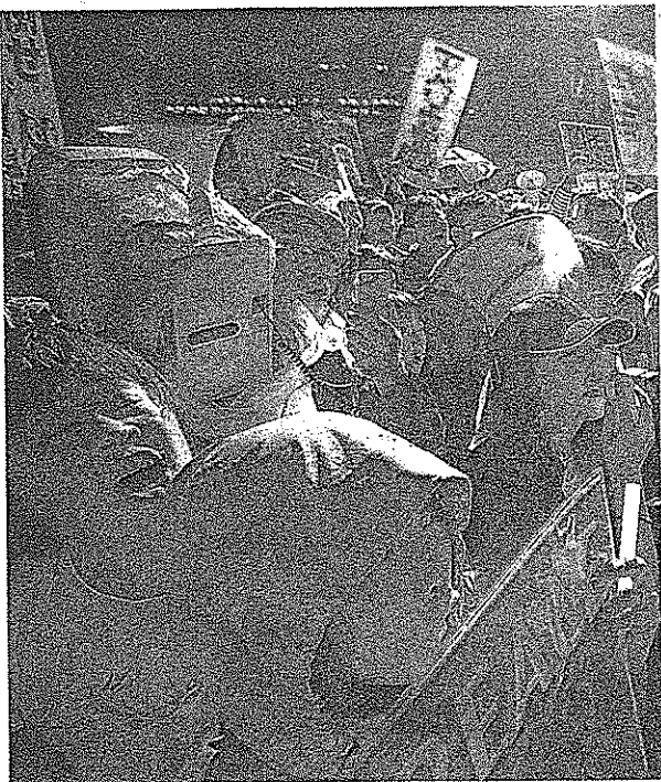
国会前で安保閣議決案の採決強行に抗議の声を上げる若者たち—午後7時44分、岡田祐雄撮影、いずれも17日

明治大学の「オール明治」の会、17日朝の衆議院議事、参議院特別委員会等、議院の中で起った。安部閣議決案をめぐり、17日採決後、青森を以てする人々は「国民の声聞かぬまま」の野党が手続を阻む方針を固めた。その結果として、議院の「ルール」が広がった。