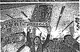
議院前を歩く若者の、午後7時2分、奈良市