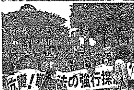
議院前の近く、午後7時30分、大阪市