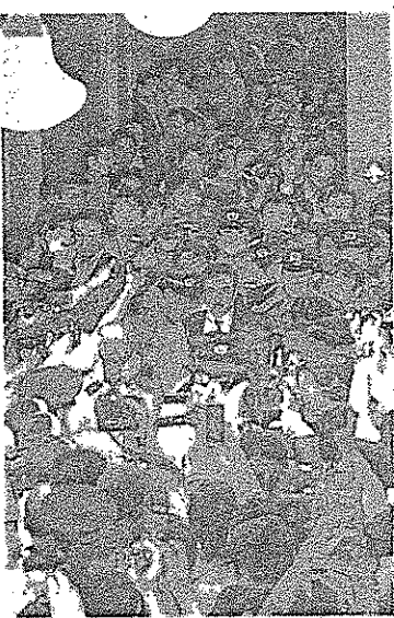
参院安保特別委の理事会へ向かう与党理事(中央)

同日 戦争法案反対の人波が新横浜駅から参院安保法制特の地方公聴会会場のホテルまで続き、反対のコールはホテル内まで響いた。会場前の抗議集会で「公聴会を開いた直後に強行採決するなど許されない。戦争法案は