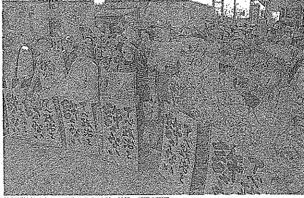
戦争法案反対集会の様子は写真で見る。16日、新潟市西區

何としてもと集う 新潟市 戦争法案反対集会 何としてもと集う。戦争法案反対集会。新潟市。16日。夜。市民が参加し、集会が行われた。集会の様子は写真で見る。