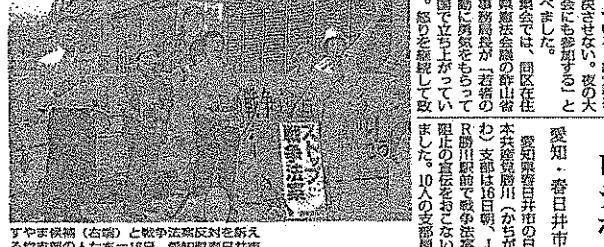
愛知・春日井市 戦争法案反対集会の様子は写真で見る。16日、愛知縣春日井市

「戦争法案阻止！緊急富山県民集会」が15日夜、富山市のC I C前広場で開かれました。県内の元首長や弁護士をはじめ各界の30人が呼びかけたもの。朝霞の高校生や旅行者からも飛び入りで参加し、400人が集まりました。地元民放テレビ局がニュース番組の中で、集会の様子を同時中継しました。