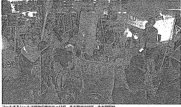
コールするシールズ東海の青年ら＝13日、名古屋市東区・名古屋駅前

スポーツ界「反対」アピール賛同533人に 野村浩将監督率いる日本代表選手も賛同した。アスリートたちは、市民の多くを巻き込んでデモ行進を行った。参加者は、市民の多くが参加した。デモ行進は、市内の主要な通りを歩行し、市民の多くが参加した。