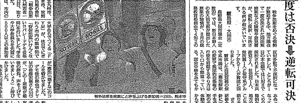
戦争法案を廃案にしようと声を上げる参加者＝13日、熊本市

度は否決 逆転可決 賛成に回る 熊本市内、若者連帯は市民の多くを巻き込んでデモ行進を行った。参加者は、市民の多くが参加した。デモ行進は、市内の主要な通りを歩行し、市民の多くが参加した。