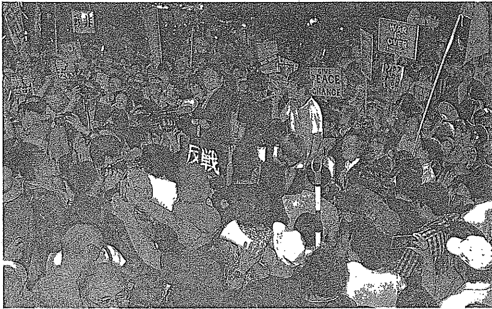
戦争法案廃案、アベはやめろ！と怒りのコールをする若者たち＝14日、国会正門前