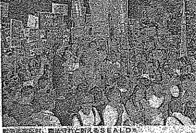
国会前で行われた抗議行動の様子が写っています。

国会前で行われた抗議行動の様子が写っています。参加者は多く、声援が絶えませんでした。