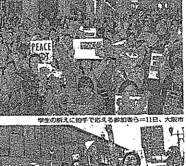
市内をパレード。一行は、市民の支持を受け、手招きで進んでいきました。

安保関連法案 #本当に止める PEACE SOUL DEMO 「民主主義ってこれだ!!」とコールしてデモ行進する参加者ら=12日、群馬県高崎市