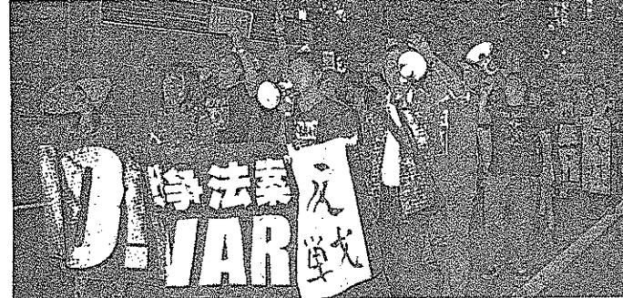
国会前で行われた抗議行動の様子が写っています。

国会前で行われた抗議行動の様子が写っています。参加者は多く、声援が絶えませんでした。