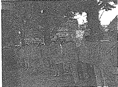
法案阻止のパネルを前にリレートークする参加者＝9日、熊本県庁前