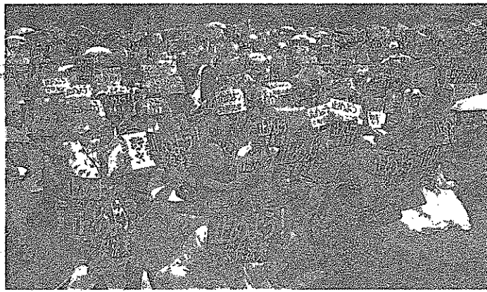
「文民統制が破られていたこと」にふれ、「いる」と批判しました。

横浜弁護士会が主催（日本弁護士連合会など共催）する「みんなで止めよう！安保法案」かながわ緊急大集会が6日、横浜市神奈川区で開かれまし