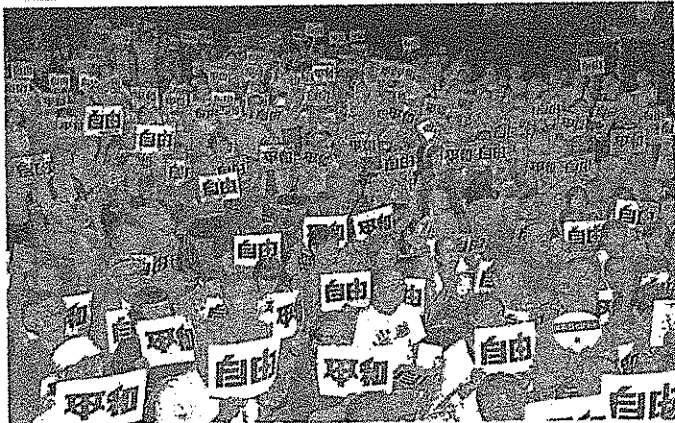
「自由と平和を守ろう」とコールする「安保法制反対集会」参加者＝1日、京都市左京区・京都大学

京都大学の教員らでつく「大有志の会」は1日、京都 る「自由と平和のための京 大学・西部講堂（京都市左