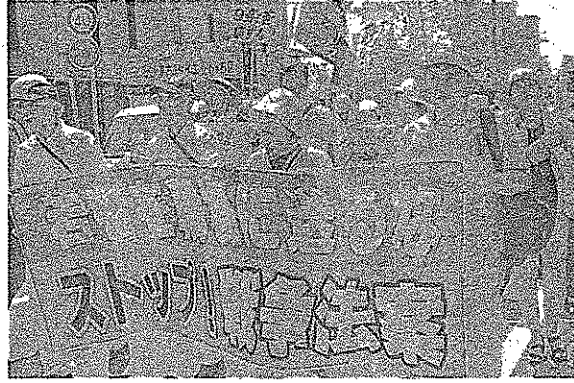
多彩な呼びかけ人により、戦争法案廃案を訴えたデモ行進=8日、新潟市西区

新潟市西区で8日、多彩な46氏の呼びかけによる戦争法案反対のデモ行進が行われ、炎天下で200人が参加しました。