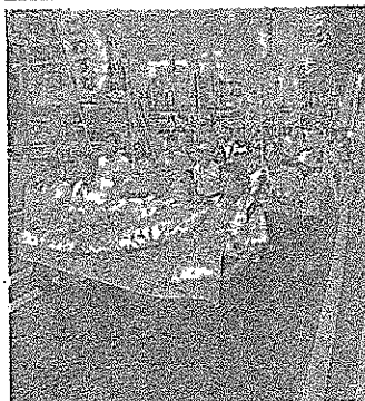
「安保法制に異議あり」とデモ行進した埼玉弁護士会。7月30日、さいたま市