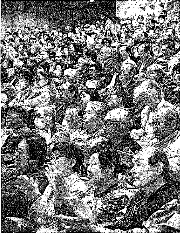
各氏の報告に拍手をする九条の会 集会参加者＝7日、東京都北区