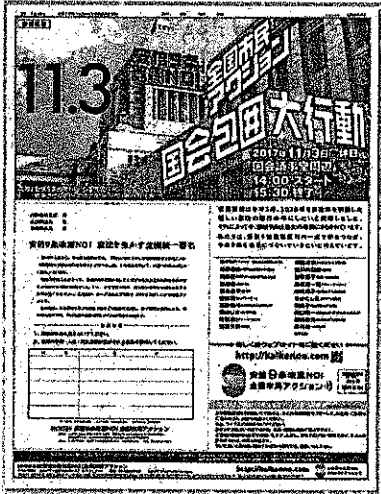
3000万人署名を掲載した市民アクションの意見広告(「朝日」10月22日付)

▽安倍晋三さんの自己中心的な行動がさらに進みそう、年金生活者ですが、寄付金も振り込む予定です。(女性)