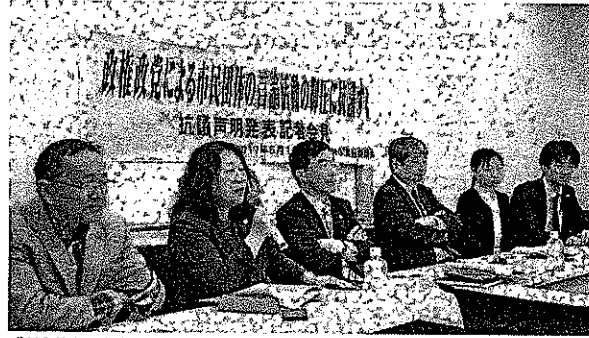
「共謀罪」法案の強行採決に抗議する弁護士ら=19日、衆院第1議員会館

「共謀罪NO」実行 連合は18日、衆院第1議員会館で開き、議員らに参加する。同日、議員会館で開き、議員らに参加する。