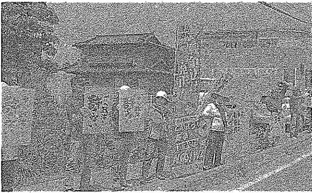
プラスターとのぼり旗で通行する車にアピール=19日、長野県富士見町