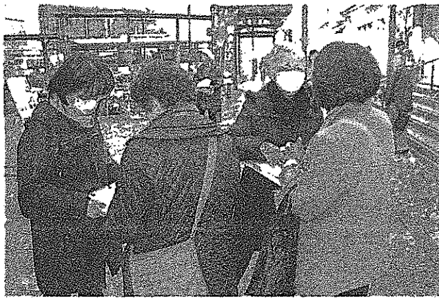
署名を呼びかける女性ら=15日、神戸市灘区

打倒を求めていることし、選挙協力も広がっや、野党5党が合意していることを説明し、