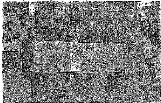
声を上げ行進する参加者—20日、熊本市