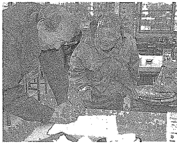
お客さんに200万署名をお願いする、 るみばあちゃん＝高松市