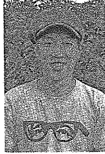
原野の再稼働に怒る。原野の再稼働に怒る。