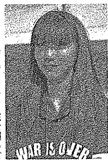
ひなこさん(16) T-nssOWL、高校生