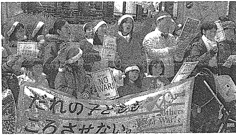
「たれの子どもも ころさせへん」と アピールするママたち(23日、大阪市)