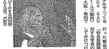
思想家の内田樹氏がシールズ関西を応援する演説の様子。

「戦争法案が通るといふ不安な気持ちで、国会前まで来た。戦争法案が通るといふ不安な気持ちで、国会前まで来た。戦争法案が通るといふ不安な気持ちで、国会前まで来た。」