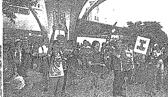
国会前で行われた抗議活動の様子。参加者は「戦争法案反対」といふ思いから、国会前まで来た。