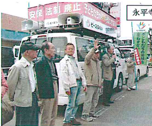
永平寺ラッキー前