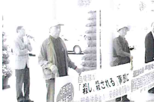
戦争法反対福井県連絡会 5月19日