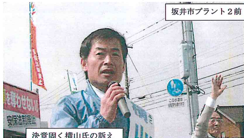
坂井市プラント2前